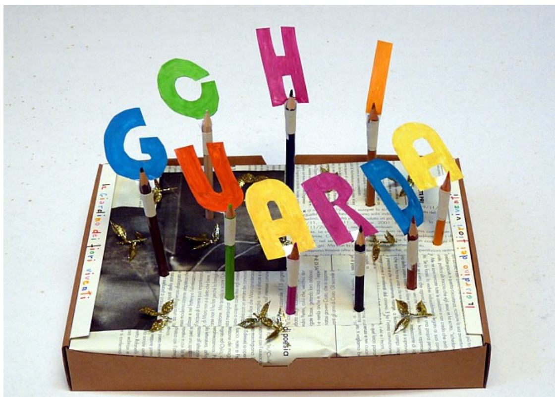
Il giardino dei fiori viventi: Chi guarda , per Facciamo finta il gioco di Alice , Galleria Il Gabbiano, La Spezia, 2010