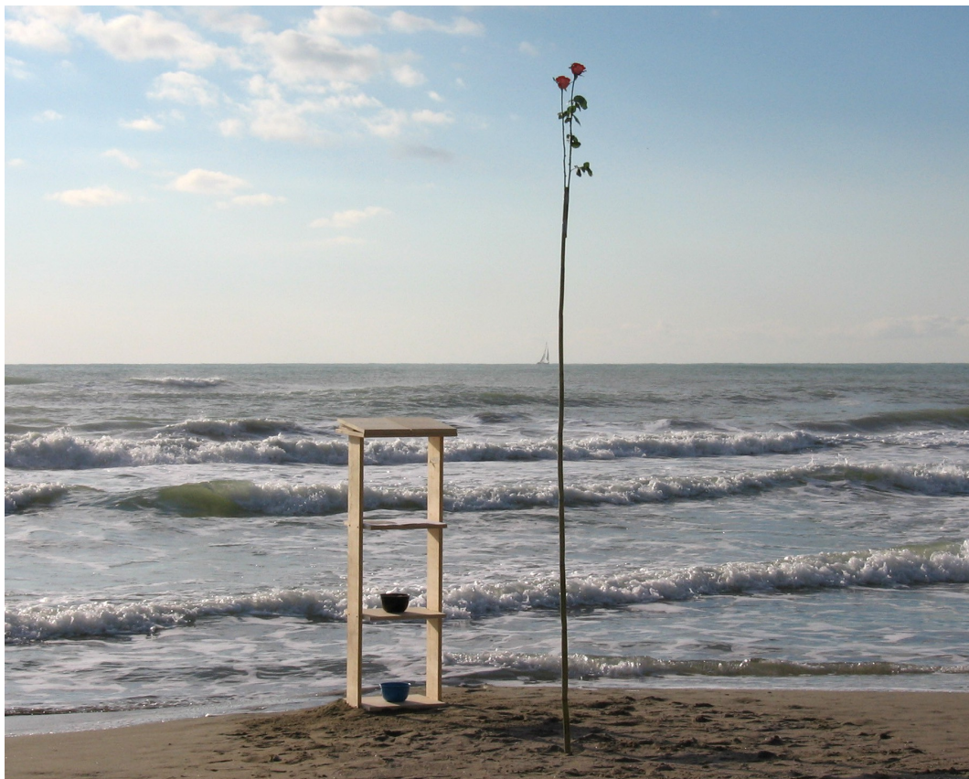
L'ultima onda, installazione in occasione delle commemorazioni di Percy Bysshe Shelley. Sul leggio un testo poetico, Love's Phylosophy, di Shelley. Spiaggia di Viareggio (LU), 7.10.2006